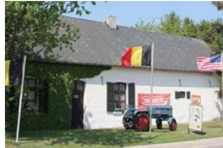
Verkeersbulldog (cabrio tractor) uit 1939

een goed bewaarde collectie landbouwmachines en -werktuigen, die kunnen worden aangedreven door enkele stationaire oerdegelijke motoren. Kinderen kunnen er oude ambachten leren zoals koemelken of springkoorden draaien. Het museum legt de link tussen het heden en het verleden met de koolzaadmobil.